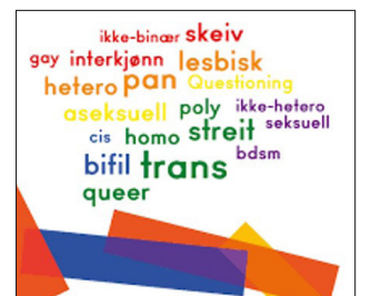
Utdrag av plakat fra FRI Oslo og Viken